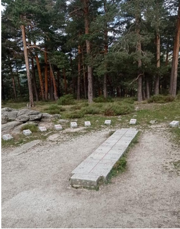
5- KM173: Reloj solar Camilo Jose Cela