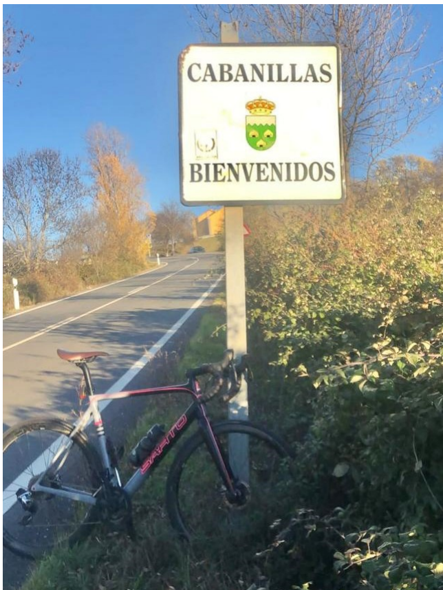
8- KM303: Cabanillas, cartel entrada pueblo