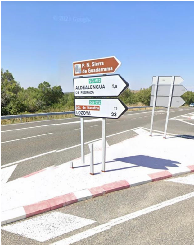
6- KM225: Desvío al pueblo de Navafria