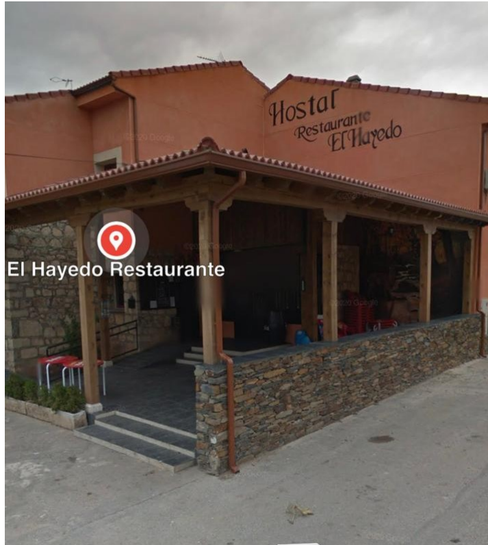
11- KM480: Cantalojas, Hostal Restaurante El Hayedo