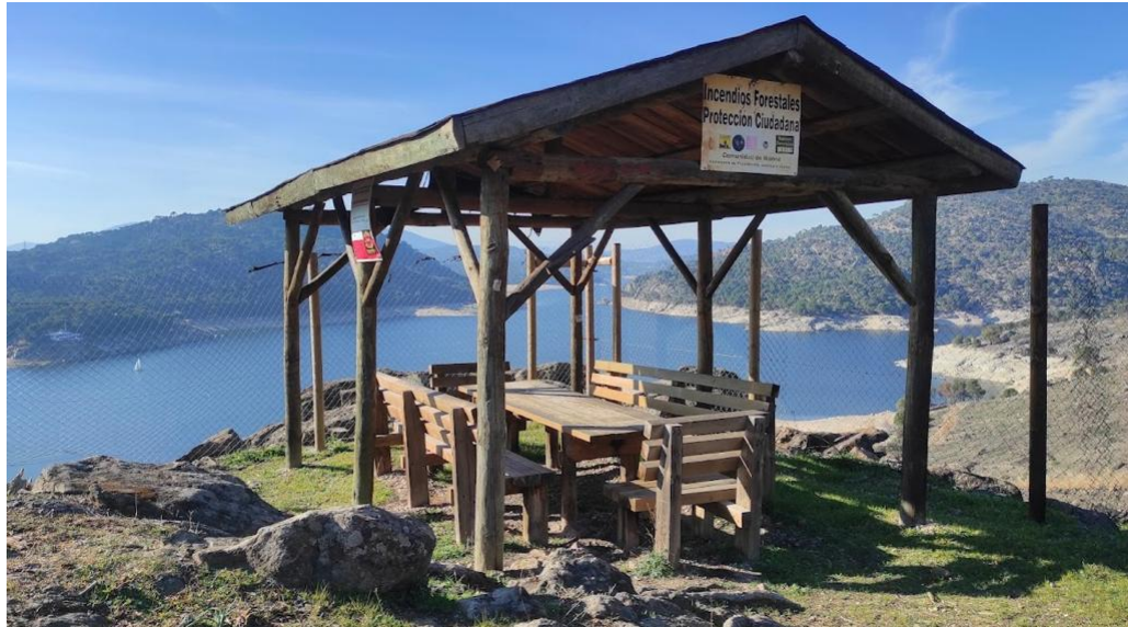
3- KM98: Mirador presa San Juan 1