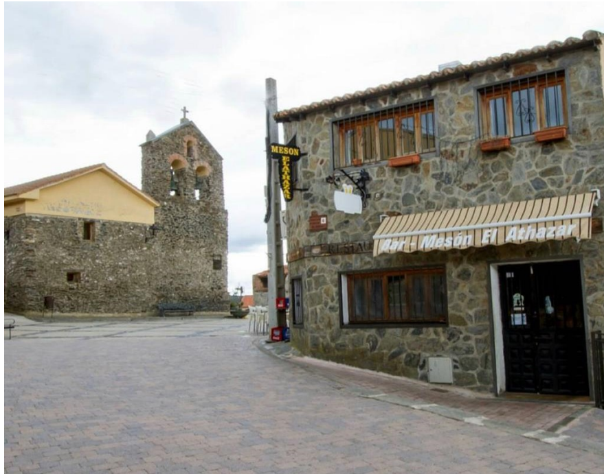
9- KM338: Atazar pueblo, Bar- Mesón El Atazar