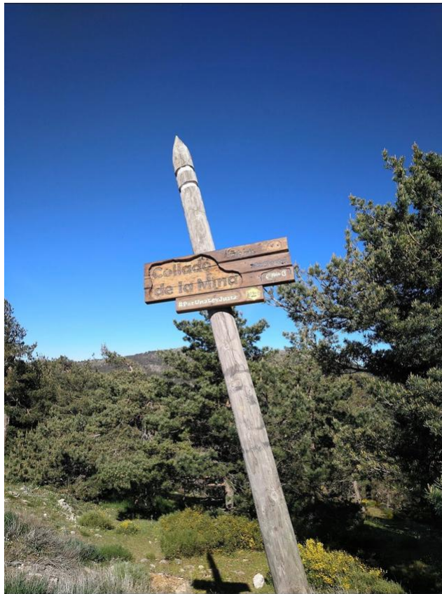
4- KM148: Collado de la mina, poste con cartel