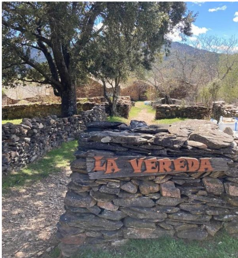
10- KM405: La Vereda, cartel de entrada al pueblo