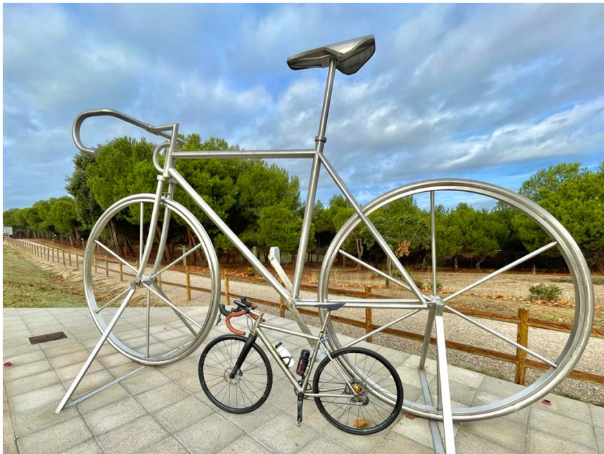
2- KM61 Sevilla la Nueva, escultura bicicleta