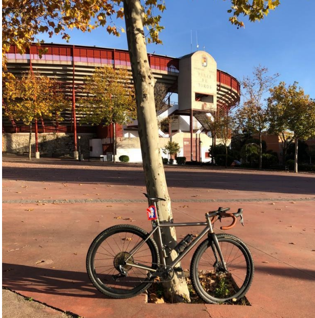
1- SALIDA : KM0 - Plaza Toros Colmenar Viejo