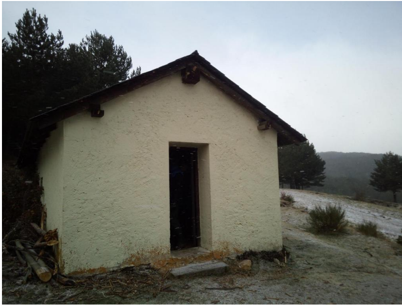
7- KM272: Refugio de el Aguilón