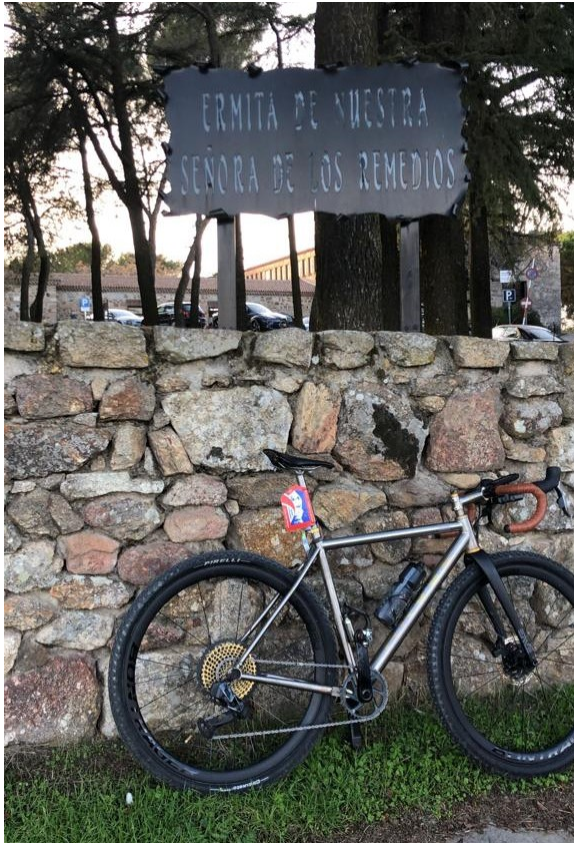
13- KM600: Ermita Nuestra Señora de los Remedios